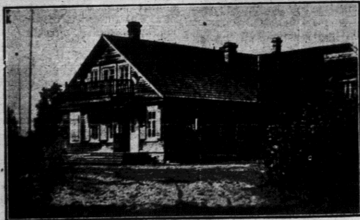
Pawilon kolonji akademickiej w Nowiczach.

Warunki klimatyczne uzdrowiska, jako miejsca wypoczynkowego, są bardzo dobre, gdyż miejscowość, położona na suchych piaskach i obfitująca w liczne słoneczne plaże, jest otoczona lasami sosnowymi.