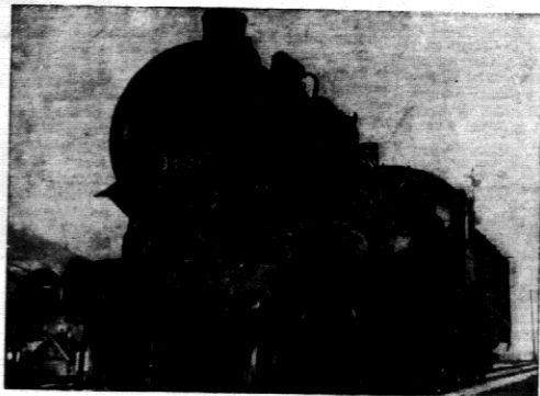
Lokomotywa ta spowodowała katastrofę, której ofiarą padło 33 osoby.