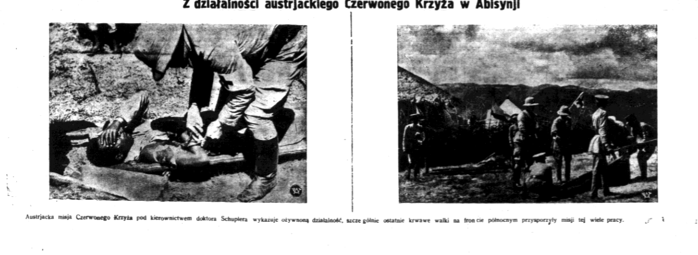
Austrjacka misja Czerwonego Krzyża pod kierownictwem doktora Schuplera wykazuje ożywną działalność, szcze gólnie ostatnie krwawe walki na froncie północnym przysporzyły im tej wiele pracy.