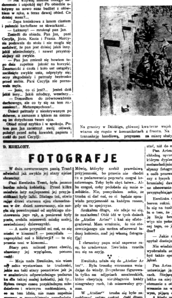
Na granicy w Dziźdży, głównej kwaterze wójsk absydyjczyków frontu północnego...