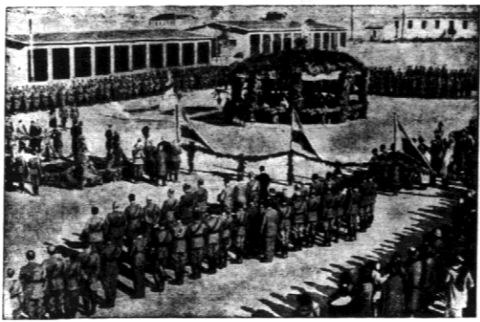
Król Jerzy wziął poraz pierwszy od czasu swego powrotu, udział w święcie artylerji, urządzanem rokrocznie ku czci i patronki św. Barbary.