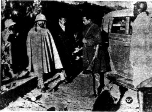
Zdjęcie z ostatniej podróży cesarza Haile Selassie na front i do głównej kwatery wojsk abisyńskich w Dessie, gdzie jak wiadomo, cesarz był obecny podczas bombardowania tego miasta. Ce sarz podróżował z zachowaniem wszelkich środków ostrożności, nie tylko on, ale i jego otoczenie, a nawet straż przyboczna ubrani byli w stroje cywilne.