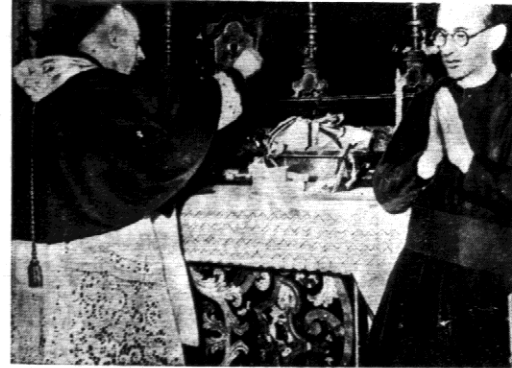
Arcybiskup Medjolan błogosławi żelazne obrączki, które otrzymują małżonkowie wzamian za złoto, złożone w ofierze ojczyźnie. Jak wiadomo pierwsza złożyła swe obrączki para królewska.