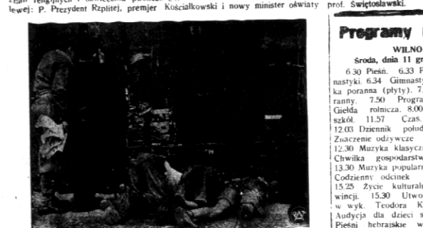
Grupa chłopców amerykańskich nie mogących sobie porzobić na nabycie karty wstępu na mecz piłki nożnej daje sobie radę jak może, by siedzieć emocjonująca rozrywka.