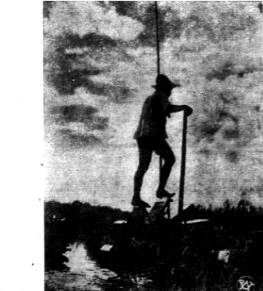
W Japonii, która całkiem swiata im postać niewiele się od siebie sprzeny słowem kraju, znalazł można zakłady, gdzie życie i technika pracy stoją na tym poziomie, co przed wiekami. Na zdjęciu — ubogi relikwja za polski w prymitywny sposób na realizujący swoje ideały.