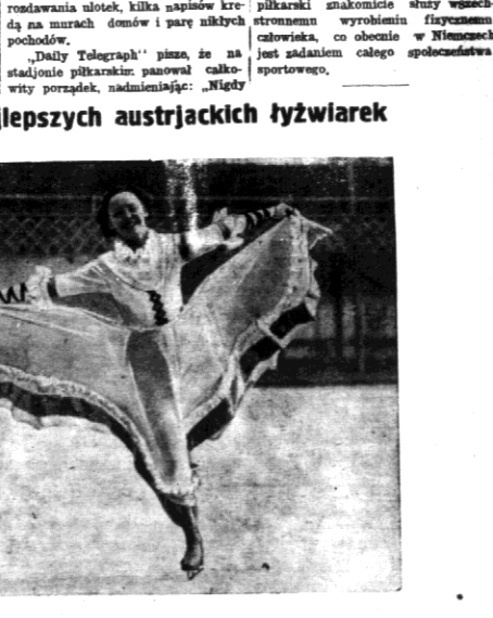
W Wiedniu odbyły się popisy mistrzyń w jeździe figurującej na lodzie. Między innymi można tam było poobserwować „tyżwiarek”.