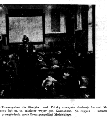
W Tokio odbyła się pod protektoratem Towarzystwa dla Studjów nad Polską uroczysta akademja ku czci Marszałka Piłsudskiego. Na akademji obecny był m. in. minister wojny gen. Kawahama. Na zdjęciu — moment akademji podczas przemówienia pioski Rzeczypospolitej Mościckiego.