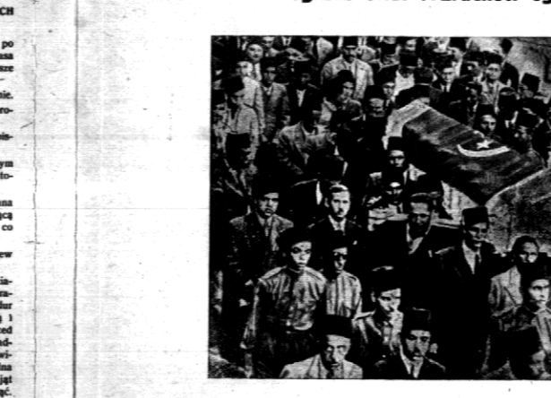
Nierwikle uroczystość pogrzebu ofiar rozruchów egipskich w Kairze.