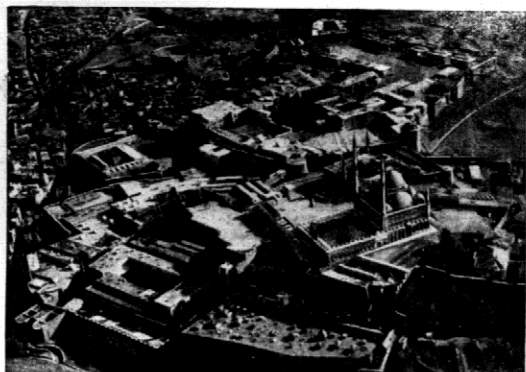
W Egipcie doszło do krwawych ekscesów antyangielskich. Na zdjęciu Kair z lotu ptaka.