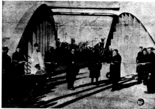
Otwarcie i poświęcenie nowowbudowanego mostu żelbetonowego na rzece Wildze w mieście Garwolinie.