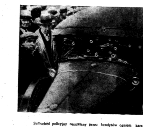
Samochód policyjny ostrzelał bandytów ogniem karabinów maszynowych.