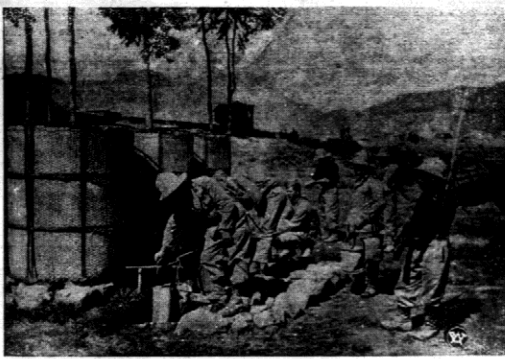
Włoska grupa Berta pod Adigratem Stacja wodna w Edaga Harms pod Makale