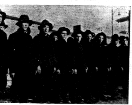
Nowe wzorowe więzienie urządzili Turcy na wyspie Imrali na morzu Marmara. Na zdjęciu więźniowie w nowych strojach.