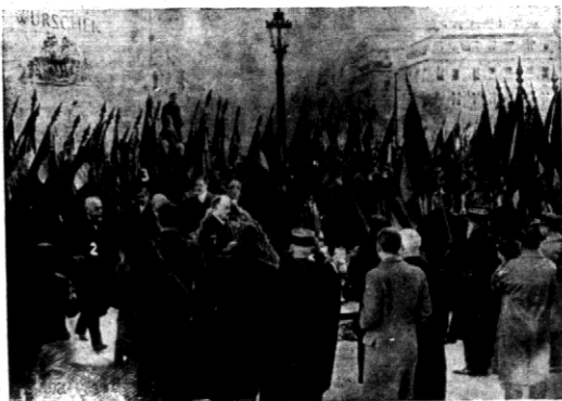
Prezydent Francji Lebrun składa wieniec na grobie Nieznanego Żołnierza. Za nim prezydent senatu Jeanneney (2) zanim Laval (3) premier ministrów