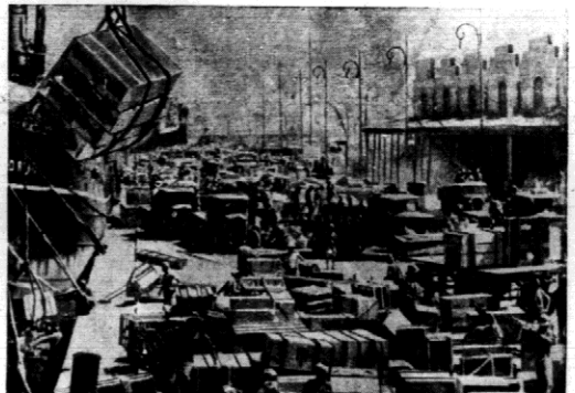
Diem i nocą wra pracą w porcie Messana we włoskiej kolonii Erytrea.