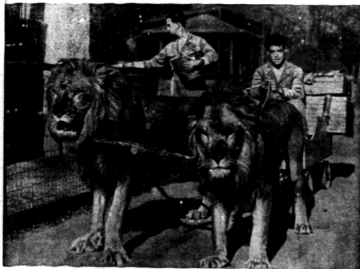
W ogrodzie zoologicznym w Kalifornii są lwy, tak ulaskawione, że używa się je jako zwierzęta pociągowe.