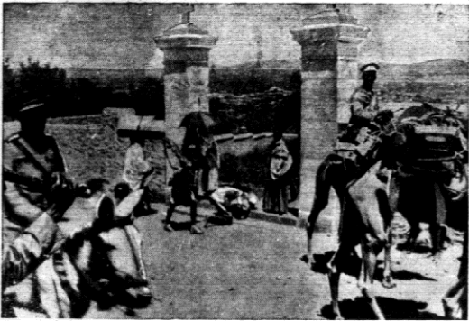
Wojujownicy abisyńscy udaję się na front z Harraru, zatrzymując świecibłdy przed kościołem św. Michała aby uczcić stopnie kościoła.