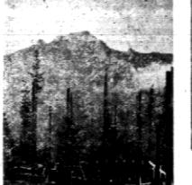
Badowa stacji Myśliczynie Turnie.