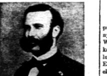
Wprawdzie w tym roku żałoby...