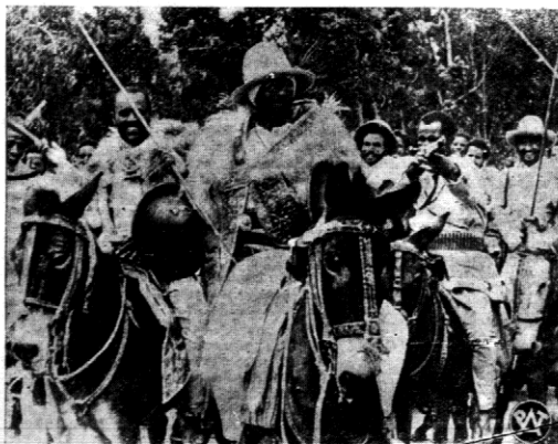
Więźni jeszcze napływają do Addis Abeby nowe oddziały sformułowane z plemion zamieszkujących krańce państwa aby poddać się rozkazom cesarza i spojono walczących na froncie.