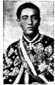
39-letni Lidj Jassu, wnuk wielkiego cesarza Menelika. We wczesnej młodości był on cesarzem Abisynji, jednakże od wstąpienia na tron jego matki cesarowej Zauditu, został pozbawiony wolności. Po śmierci jego matki objął rząd obecny cesarz Haile Selassie. Lidj Jassu, który dotąd przebywał na zamku w Harrar, został obecnie wyzwolony bardziej wgląd Abisynji, aby nie wpadł w ręce Włochów.