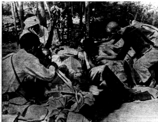
Sanitariusze abisyńscy opatrują rannych za frontem.