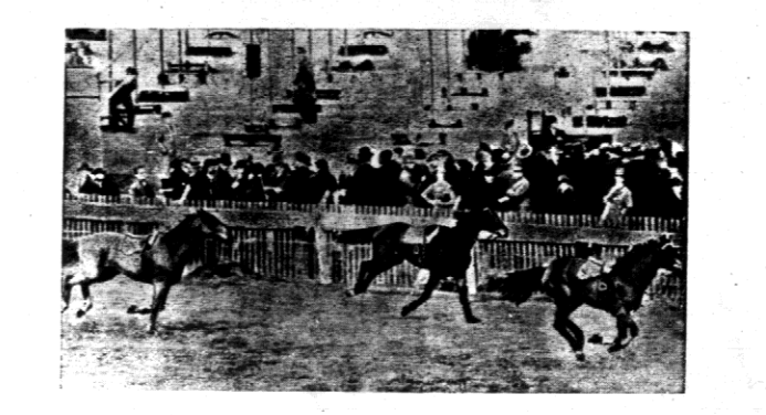
Finisa Olimpia — stęple chłane na klasie systemu torze wyścigowym w Mooney-Valley w Australji, gdzie trzy pierwsze konie minęły celownik bez jędded.