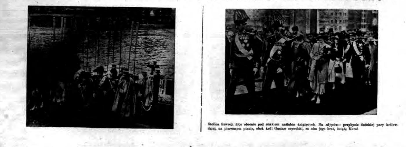
Stolica Szwecji żyje obecnie pod znakiem zaślubin książęcych. Na zdjęciu — przybycie duńskiej pary królewskiej, na pierwszym planie, obok król Gustaw szwedzki, a nim jego brat, książę Karol.