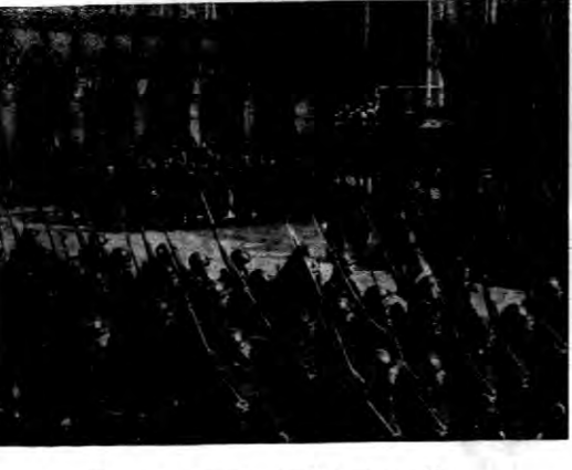
Na zdjęciu trzyczęstości paryskie przed pokazem.