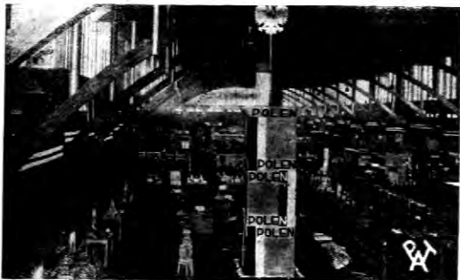
Stoisko polskie na wystawie południowo-wschodniej we Wrocławiu.