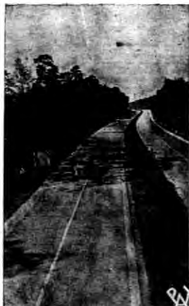
Natychmiast po otwarciu nowej wspólniejszej autostrady Frankfurt - Darmstadt uruchomiono linię poprzecznych autobusów.