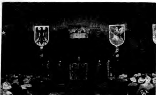
Uroczystość otwarcia wystawy południowo-wschodniej we Wrocławiu. Tarcza z godłem państwowym Polski przysłana kirem żakobnym.