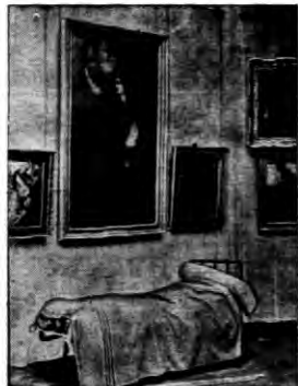
Na wystawie obrazów włoskich mistrzów ustawiono przed bezcennymi dziełami starych mistrzów włoskich, która na których wypis: policjanci, by utrzymać obrazy od kradzieży.