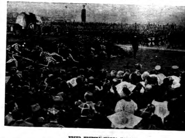
PRZED TRUMNĄ WODZA NARODU.