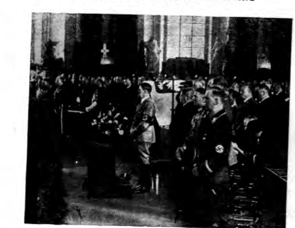
Kancelarz Hitler na nabożeństwie za duszę p. Marszałka Piłsudskiego w katedrze św. Jadwigi w Berlinie.