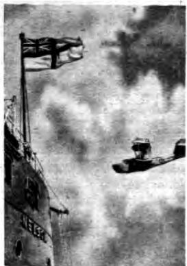
Z okazji jubileuszu królewskiego flota angielska zarządziła kotwiczenie w ujściu Tamizy, gdzie obchodzi się parada floty. Na zdjęciu wielki okręt wojenny „Nelson” z wodopławkowcami wojennymi marynarki.