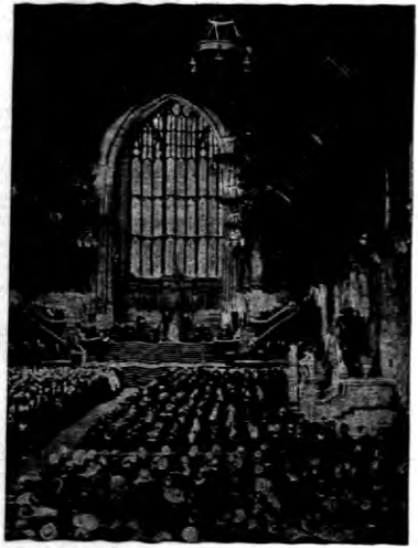
Para królewska przyjmując w Westminster żywienia lady Lordów i para męska.