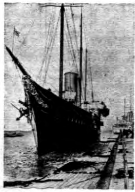
Jacht króla Anglii „Victoria and Albert” opuszcza dok w Portsmouth, po odnowieniu.