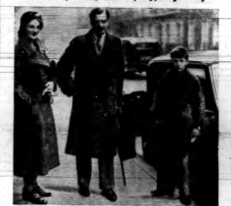
Podróż lorda strażnika pieczęci po kontynencie, sfatygowano go tak bardzo, że obecnie, wskutek niedomagania serca opuszcza Londyn i udaje się zagranicę na kurację.