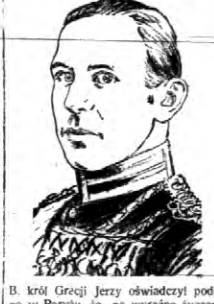
B. król Grecji Jerzy oświadczył podobno w Paryżu, że na wyrażenie życzenia greckich monarchistów ma powrócić do Aten i objąć tron.