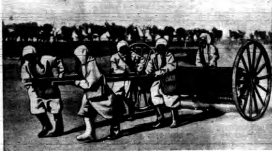
Na zdjęciu oddział w ubiorach gumowych Monte Carlo przed ruiną