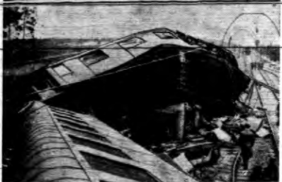
T. zw. express pierniejski, na linii Hendaye — Paryż wykołosił się przejeżdżając przez stację Marcheprie, w tempie 108 km. na godzinę. Na trzasknięcie wozów pociągu siedem wykoczyło z szyn. W kabinach 4 osoby straciły życie, a przeszło 40 jest ciężko rannych.