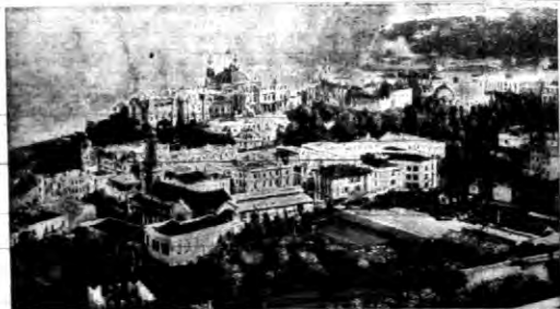
Akcyjnarzysze kasyna w Monte Carlo odbyły w środę posiedzenie, przy czym okazało się, że dochońd kasyna w roku ubiegłym wyniósł załedwie 150.000 franków, podczas gdy w roku poprzednim przyniosło ono 5.000.000 franków. Prawdopodobnie kasyno zostanie wkrótce zamknięte. Na zdjęciu ogólny widok na Monte Carlo.