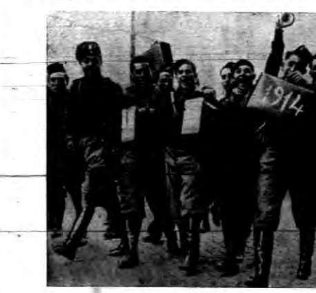
Poborowy rocznika 1914 we Włoszech wykonujący wielki zapal do służby wojskowej.