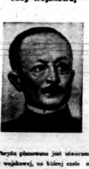
W Paryżu planowane jest utworzenie rady wojskowej, na której czele ma stanąć general Weygand.