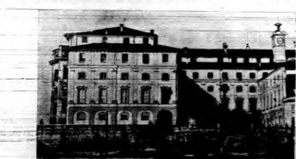
Zamek Boronowo na łozie Beia w Lago Maggiore, gdzie przedstawiciele Włoch Anglii i Francji odbyły konferencję.

PARYZ. — Uwaga kł. politycznych środowisk jest obecnie na przygotowanie czynnika w związku z zbliżającą się konferencją w Stresie. Wobec tego, że Mac Donald, jedyny do Stresy, panuje przekonanie, że na najbliższym posiedzeniu na wiosnę Mac Laval zapadnie uchwała, by premier Finlandy wybrał się na konferencję. Prasa kładzie nacisk na to, by konferencja w Stresie doprowadziła do