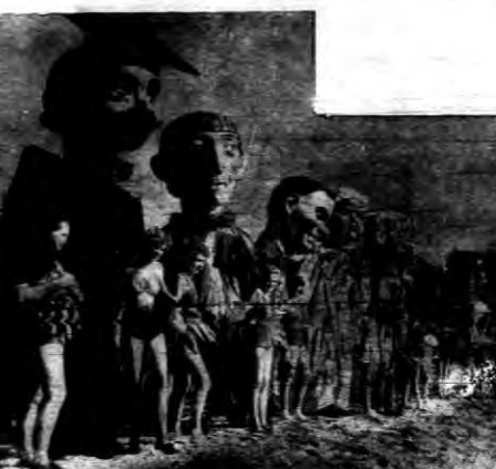
Groteskowe figury jako gwaranta pięknych pań.