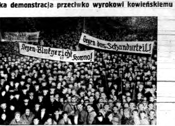
W Berlinie odbyła się obywatelska demonstracja na znak protestu przeciwko wyroku sądu kowieńskiego...