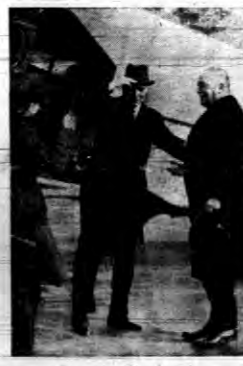
Angielski minister spraw zagranicznych sir John Simon na lotnisku Tangenhofie urzędził odlotem.