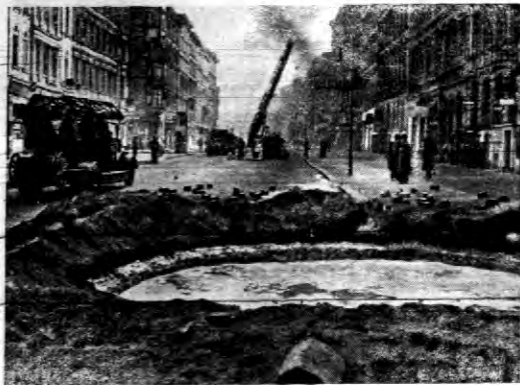
Czerwienia przeciwlotnicze w Berlinie wykonywano z tak dokładnym nadzorem, że wystrzały, a nawet w niektórych miejscach rozkopano ulice, celem odwrócenia groźnej przyrodo.