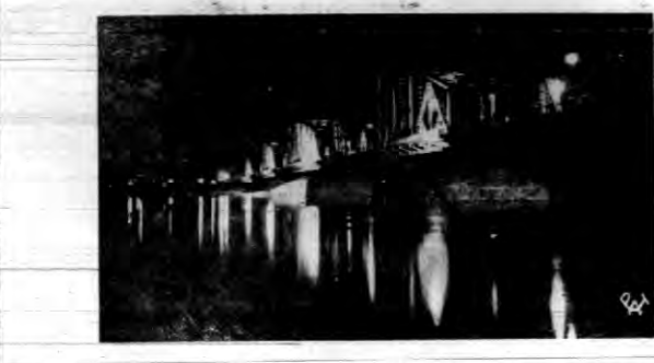
Podczas uroczystości z okazji Imienin Pana Marszałka Józefa Piłsudskiego w Toruniu najpiękniej iluminowany był nowy most im. Marszałka Piłsudskiego. Każde przelotne powietrze było potęgą refleksjami. Zdjęcie przedstawia widok mostu w powodzi światła.