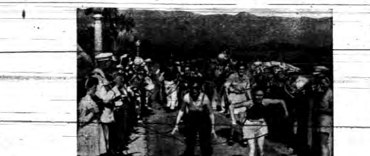
Wrotki zjadają nowych zwolenników. Na zdjęciu studenci i studenci uniwersytetu w Kolofonii, uczestniczą w wyścigu na przetrześci i km. przyciem zwycięża młoda dziewczyna...