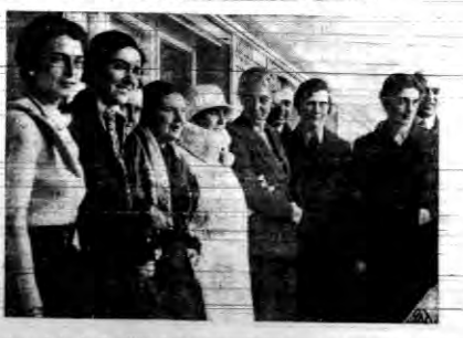
Królowa holenderska Wilhelmina i ks. Juliana przybyły na kilkutygodniowy wypoczynek do Entenswiler w Szwajcarii. Na zdjęciu — królowa (w białym płaszczu) i ks. Juliana (na lewo od królowej) na tarasie hotelu w Entenswiler.