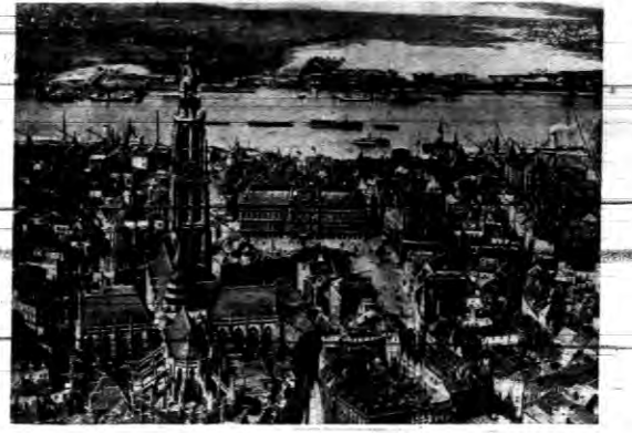
Ogólny widok na Antwerpję, drugie z lewej miasto Belgii, które z polecenia gubernatora prowincji tejsze narwy wstrzymało swe płatności.