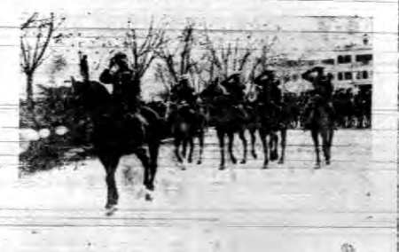
Wymarsz pułku wojsk rządowych greckich do okręgu Ceres.