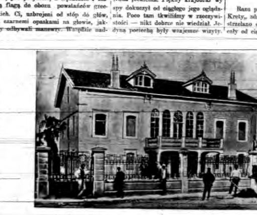
Dom Venizelosa w Kanoa na Krecie, gdzie zbierają się wszystkie nocy...