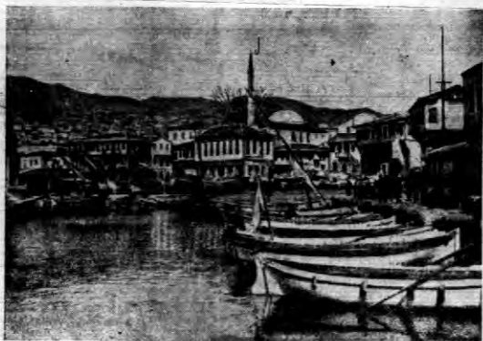
Kavalla — centrum ruchu powstańczego