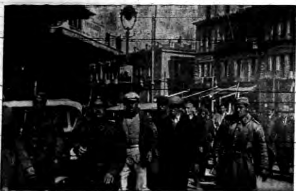
Pierwsze oryginalne zdjęcie z powstania w Grecji. Na lewo odprawiających jeńców pod siłą eskorty. Na prawo żołnierze z oddziału Ezerow, rełty wojska greckiego, którzy przeszli na stronę powstalców.