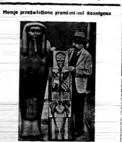
W laboratorium londyńskiego muzeum Hall, zrobiono zdjęcie mumii...