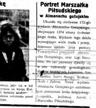
Ukazało się niedawno 172-gie wydanie „Almanachu Gójskiego”...