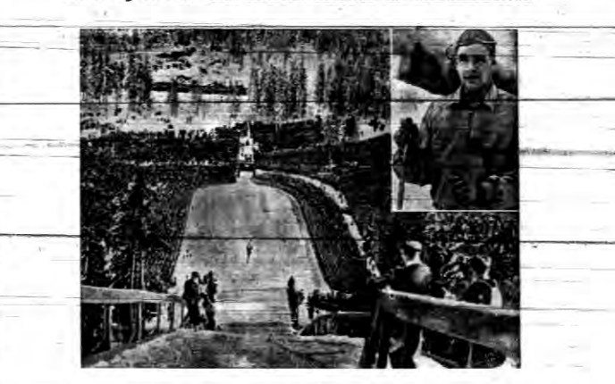
W weekend 60.000 widzów i norweskich par królewskich...