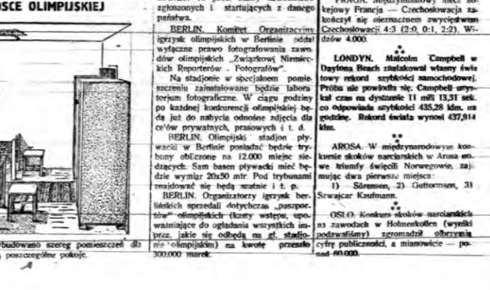
W wiosce olimpijskiej w Nienachce wybudowano szereg pomieszczeń dla uczestników olimpiady...