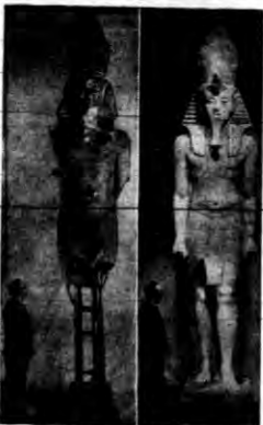
Jak wiadomo w słynnym grobie Tutenkamon, odkrytym w roku 1922, znaleziono prawie sześciometrową statuetkę króla Tutenkama...