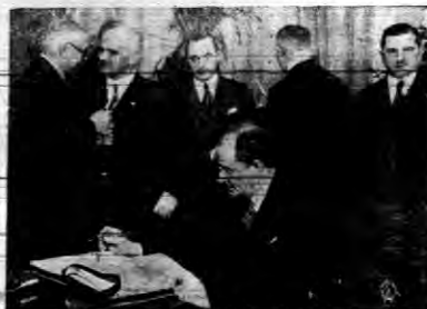
W nowo otwartych lokalach Związku Inwalidów w Warszawie. W tle: prezydent Honorowy, przewodniczący, sekretarz i inni członkowie Zarządu.