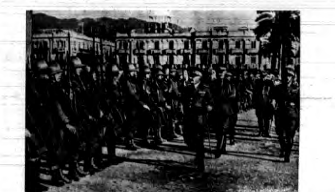
Znowu odjechał z Mesyny większy transport wojsk włoskich do Afryki. Przed przykrowaniem oddziałów był przeglad ich general Biatroseli, sekretarza sztabu w nin. wojny.