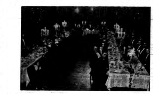
Norweski komitet olimpijski zorganizował w Grand Hotelu w Oslo bankiet...