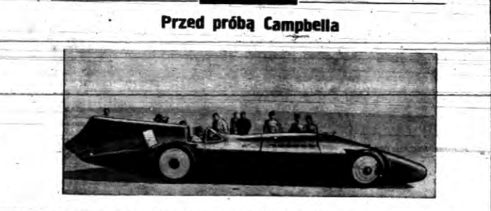
Jak obecnie płaszczyznę posiadacz bezwzględnie rekordów szybkości Campbell przygotowuje się do nowej próby...