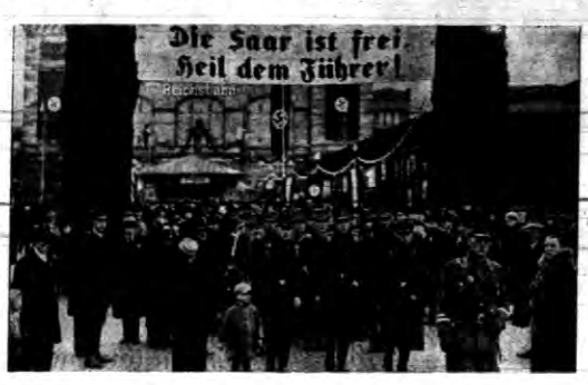
W Zagłębiu Saary święcono uroczysto dzień wcielania Zagłębia do Niemiec...