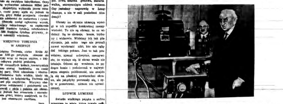
Wielki film Ludwika Lumiere, który przedstawił swój film plastyczny w paryskiej Akademii Umiejętności.

Przed paru miesiącami wszystkie gęstoje transatlantyckie poświęcone były... A więc mamy naprawdę plastyczny film