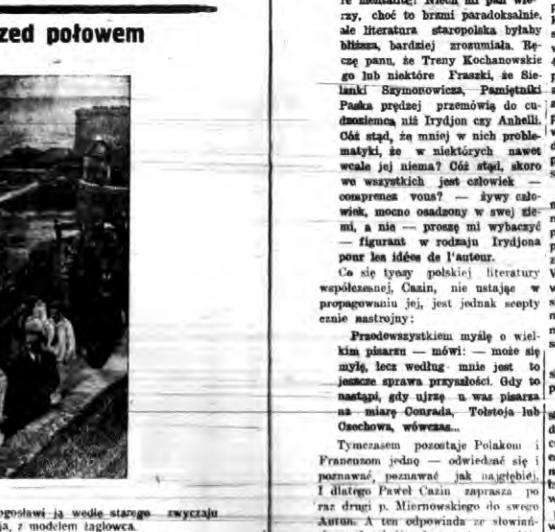
Przed wyprawą flotylli rybackiej z St. Mato w północnej Francji...