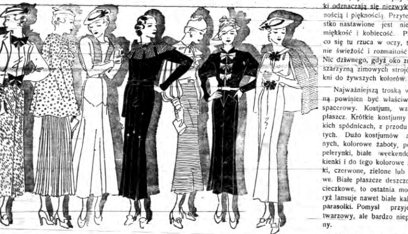
Plisowania, kokardy, wstążki.

Nowa moda, najmłodsza, już jest w nowości i oryginalna. Nie jest pewnego trudu można przetrwać nie przynosi jakichś zmian zasadniczych, to jednak bogata