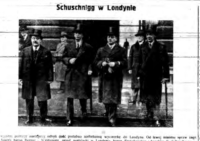
Wystąpił politycy austriacki odbył dość podobną niefortunną wycieczkę do Londynu...