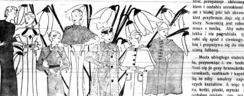
Odmiany pól „zapiętych”

Obok krótkich kostiumów użyczymy całą moc i zw. „robes mantaux”. Dawnie ten rodzaj sukien był strojem raczej starszych pań.