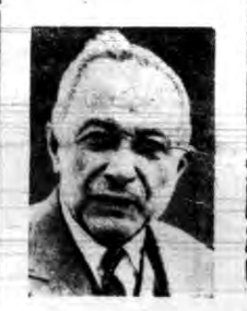
W 70-tu roku życia, w dniu swych mo- dziół, zmarł prof. Junkers, założyciel największej fabryki lotniczej w Niemczech.