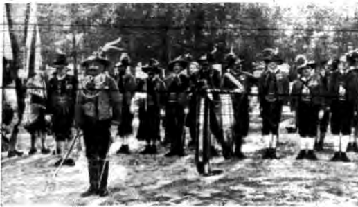
Z racji 125 rocznicy rozstrzelania bohatera walk o wolność Tyrolu Andrzeja Hofera, odbyły się uroczystości na górze Isel, gdzie Hofer odniósł wspaniałe zwycięstwo nad Francuzami.