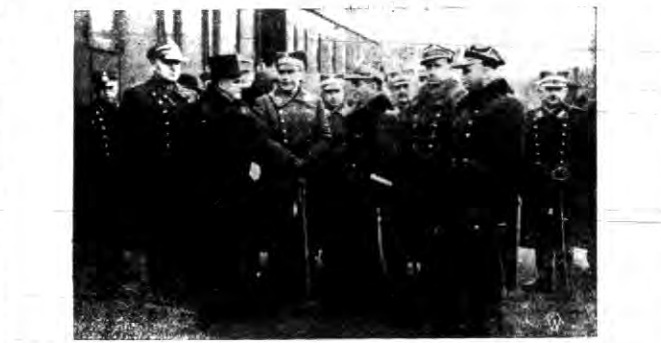
Gen. Gasiński w towarzystwie szefa sztabu głównego gen. J. Gasińskiego...