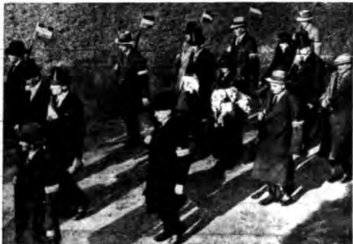
Holandzi wprowadzono oryginalny zrywacz. Ono gwardja złożona z naprzemiennie obywateli, eskortuje burmistrza, i okazji różnych uroczystości.