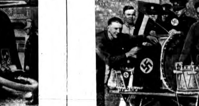
Odchodzący z Zagłębia Saary (pół pochoty angielskiej) z Enns, zabrali sobie na pamiątkę swastykę.