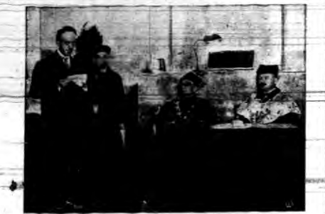
W ub. niedzieli odbyła się na Uniwersytecie Warszawskim uroczysta... Nadanie doktoratu honorowego prof. L. W. De Broglie na doktora honoris Causa.