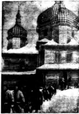
P. nabożeństwo w cerkwi w Worochcie.