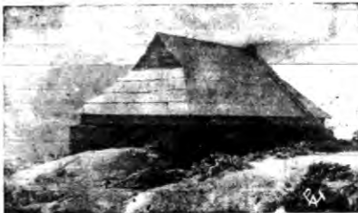
Schronisko sekcji narciarskiej warszawskiego A. Z. S w Czarnohorze.