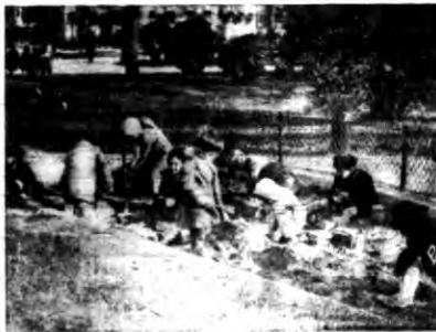
Na zdjęciu — dziewczynka paryska k korzystająca z pięknej pogody.