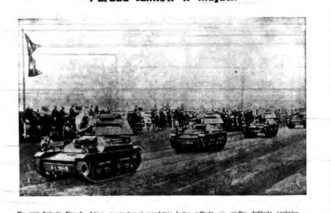
Ku czci królowej Nepalu, która rewidowała... W tym celu przyjechał do Brna... W tym celu przyjechał do Brna...