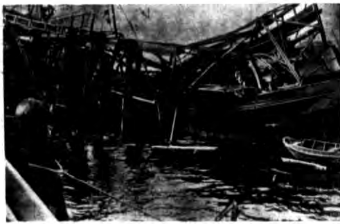
Zniszczenie w porcie amsterdamskim.