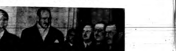
Austrjacy ministrowie w Paryżu