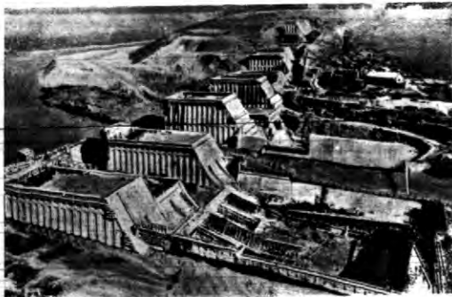
W dolinie Tennessee projektowana jest grobla olbrzymich rozmiarów. Będzie ona ułożona z betonu, a wysokość jej wyniesie przeszło 60 metrów. Koszt budowy opiewają w projekcie na 31 milionów dolarów.