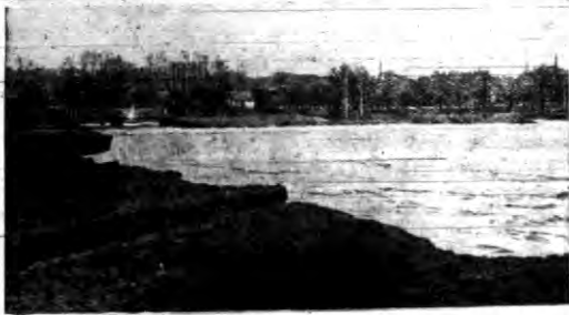
Na skutek szybkiego topnienia śniegu wystąpiła z brzegów rzeka Reissa i pod Oberbanją wyłobyla sobie zupełnie nowe koryto.