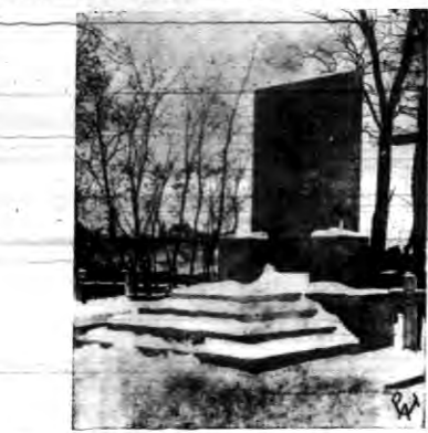
Pomnik na cmentarzu parafjalnym w Lubartowie na grobie 22-go pułku legionistów poległych w 1915 roku na polu bitwy Lubartowskiej...