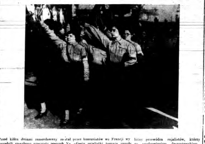
Przed kilku dniami zamordowany został przez komunistów we Francji wybitny przywódca rojalistów...