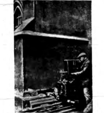
Do odnowienia starych murów zagrożonych wilgocią...

Współpracujecie z Wycho- dźtem dają grozę na fun- dusze szkolnictwa zagranicą