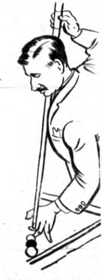
Belgijski van Belle zdobył ponownie tytuł...

Współpracujecie z Wycho- dźtem dają grozę na fun- dusze szkolnictwa zagranicą