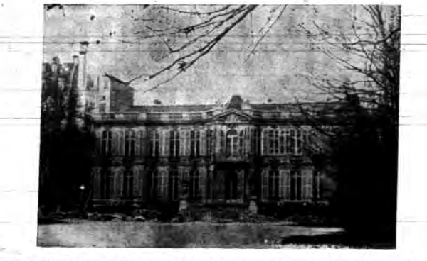
Francuski premier Flandrin przenosi się w tych dniach do pałacu „Mantignon” ...