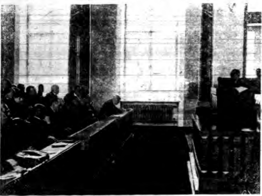
Minister Józef Beck podczas wygłoszenia exposé na posiedzeniu sejmowej komisji spraw zagranicznych w dniu 1 lutego r.