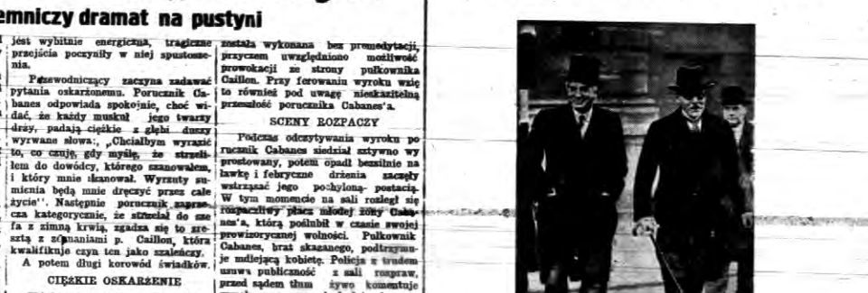
Przemysław Mac Donald angielski prezydent ministrów i angielski minister spr. zagranicznych Sir John Simon ...