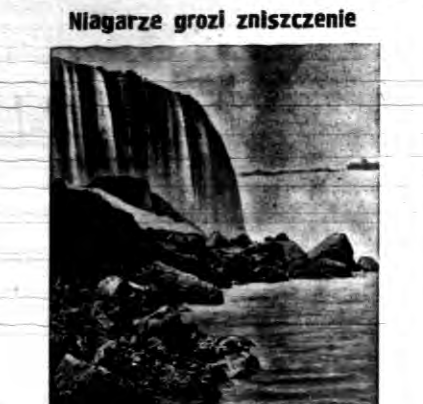
Niagarze grozi zniszczenie. Działanie wód na skały wodospadu Niagary jest tak duże, że grozi zniszczenie wspaniałego wodospadu. Prezydent Roosevelt zarządził w porozumieniu z radą kandydacji sprawa... (text continues)