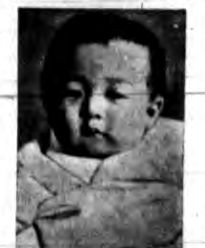
Następca tronu Japonji Akihito (sugano - Miya).