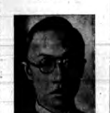
Wedle depesz z Singapooru, cesarz Mandżukuo, Puyi zachorował niebezpiecznie.