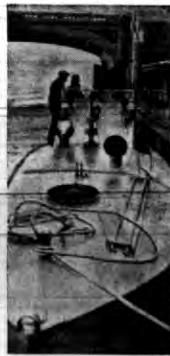
W Anglii ukończono właśnie budowę czterech łodzi torpedowych, które niepodobnie są do dotychczasowych — dają tego rodzaju. Posiadają one po dwa motory i rozwijają szybkość przeszło 90 kna, na godzinę.