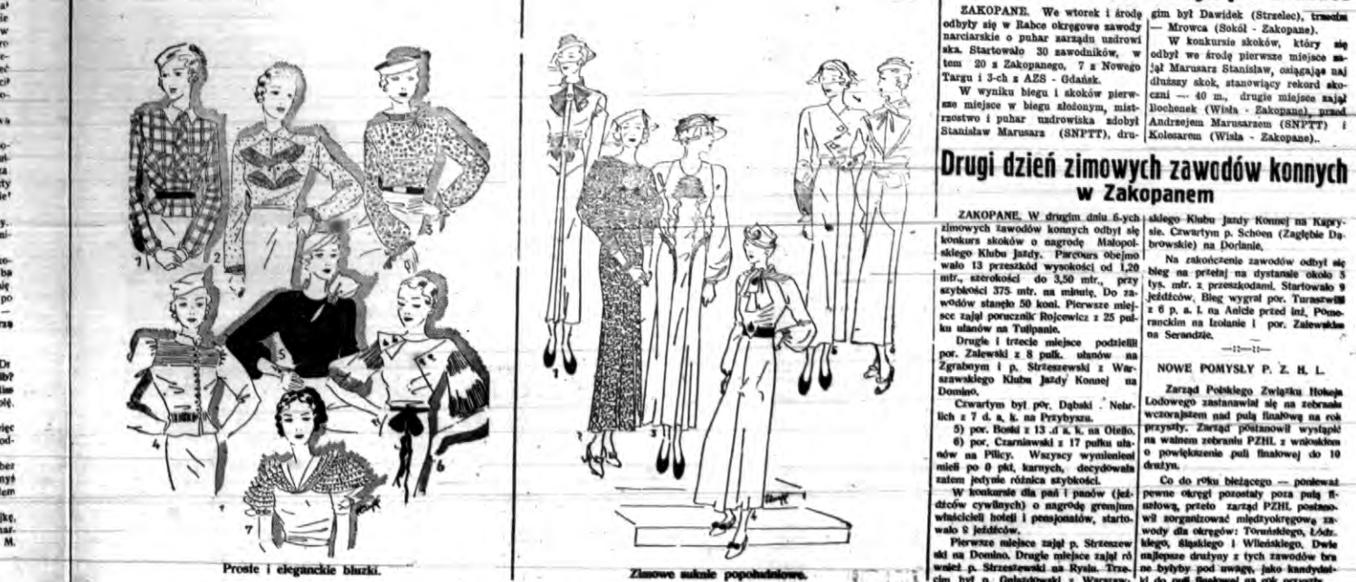
Proste i eleganckie bluzki.