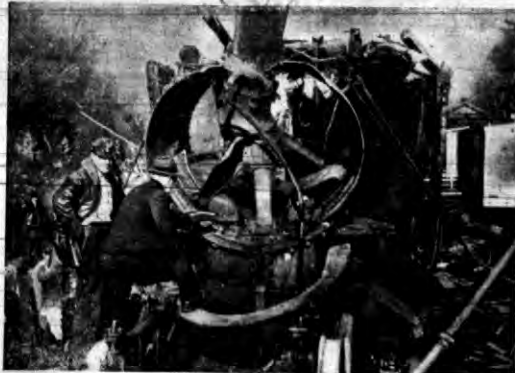
W pobliżu Powellton (Zach. Włocławia) wydarzyła się straszna katastrofa w kopalni. Podczas jazdy eksploatował kocioł lokomotywy kopalnia. W na konioch. Na zdjęciu rozerwana lokomotywa, której części stalowe zostały wyrzucone w szerokim promieniu.