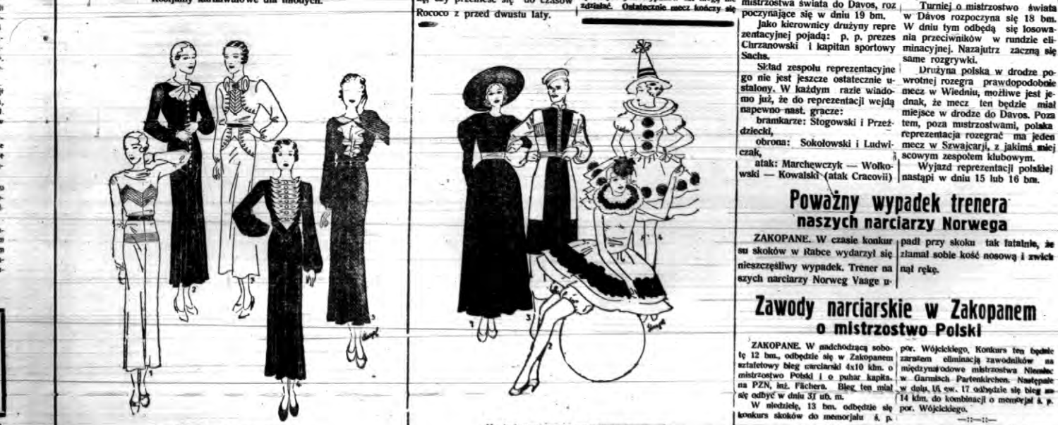
Na bal maskowy i szaleństwa karnawale.