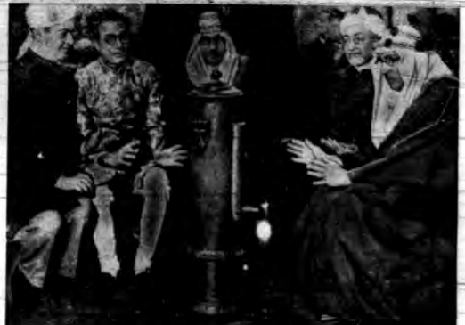
W tych dniach święcił Mahometanie londyński święto Namadan, jedno z najświętszych w kościele mahometanów. W międzyczasie zapowiadano w Londynie takie chłody, że synowie góracie nie marzli i musieli się ogrzewać przy specjalnie na ten cel ustawionych piecykach.