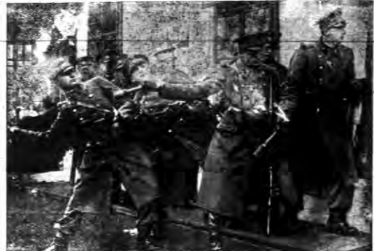
Oddział szturmowy alakuje dom granatami ręcznymi.