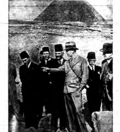
Następca tronu szwedzkiego Gustaw Adolf z okazji długiej podróży przybył do Kairo, gdzie odwiedził ostatnio wykopiska u stóp piramid.