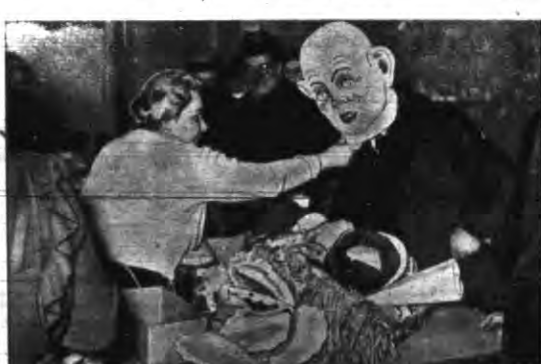
W sklepach trwał przed Nowym Rokiem ruch. Na zdjęciu przyjmowanie maski.