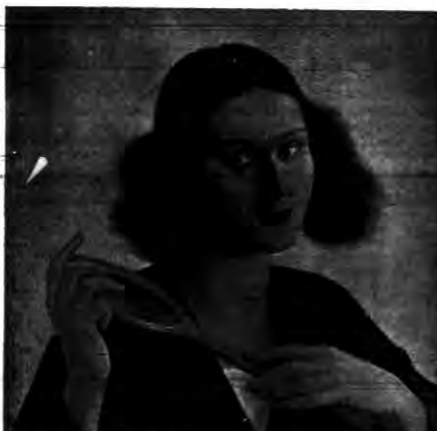
„Portret p. N. S.” (olej)