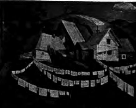
„Fragment kompozycji” (ciepł)