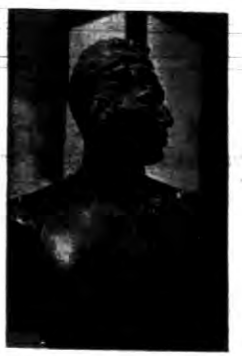
„Portret p. W.”