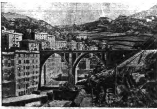
W związku z wielkim planem rządu włoskiego, skierowanego do wybudowania osony służącej wyłącznie do komunikacji dla samochodów ciężarowych z Genui do Włoch Północnych.