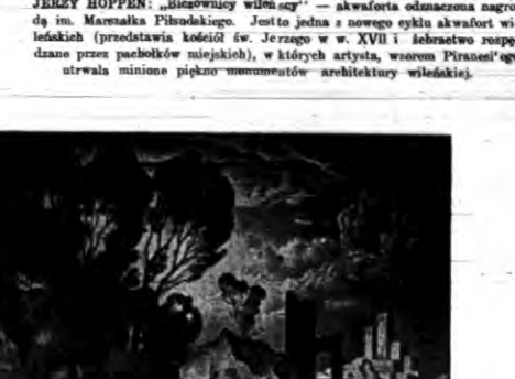
BRONISŁAW JAMONTT: „Wspomnienie z Tołkajki”