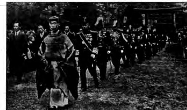
Na cześć cesarza japońskiego Mutsuhito, który panował w Japonii od 1867 do 1912 r. odbyły się w Japonii uroczystości...