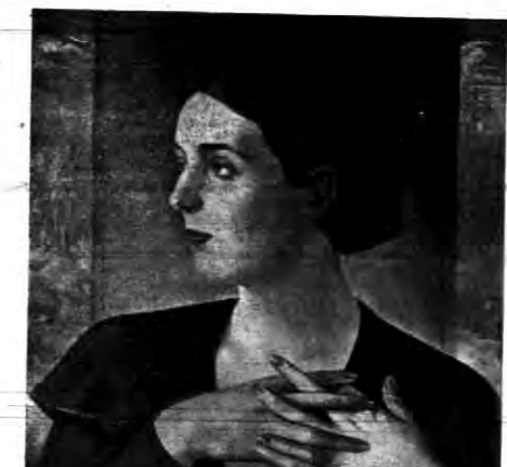
„Portret p. L. L.” (olej)