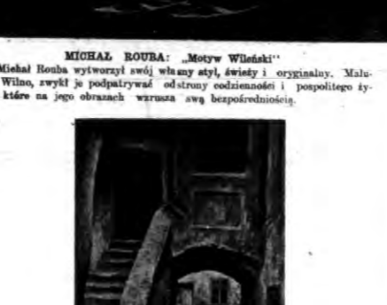
BRONISŁAW JAMONTT: „Podwórno wileński”