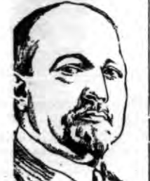
W. wiceburmistrz skarbu, senator hr. Volpi, został powołany do wielkiej rady kaszubskiej.