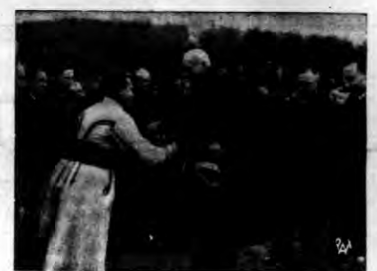
Na zdjęciu — przedstawiciele okolicznych gmin wita Pana Prezydenta Rzeczypospolitej.