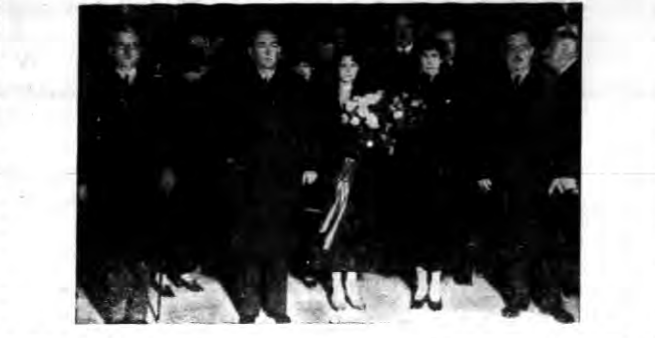
Kanclerz austriacki dr. Schuschnigg, pojeżdżający był w Budapeszcie...