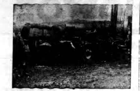
Pociąg, którym kanclerz Hitler powracał z Bremy do Berlina, najechał na przejeżdżający autobus... Zderzenie nastąpiło w godzinach popołudniowych, przy czym 14 osób straciło życie...