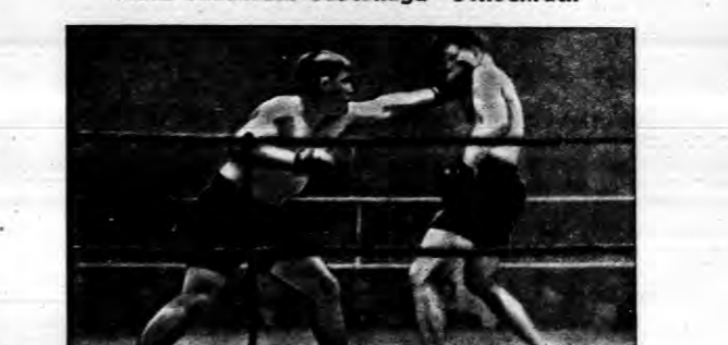
30 listopada rozegrano powyższy mecz...