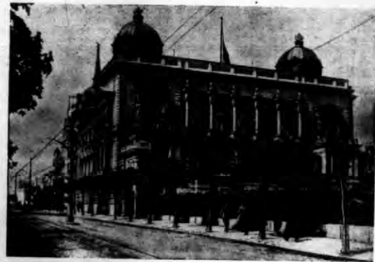
Tu nastąpi wystawienie na widok pu bliższy ciała zmarłego króla, oraz za przyświecenie młodego króla Piotra.