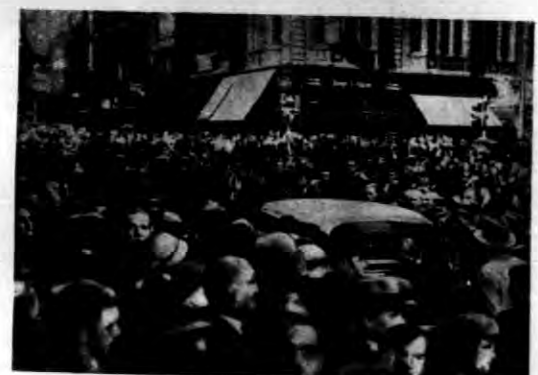
W czasie odjazdu na dworzec w Łan-dynie zgromadziło się mnóstwo królówi Piotrowi II burzliwe owacje, wyrażające gorące sympatje.

ZYKOZENIA MARSZAŁKA PIŁSUDSKIEGO DO KOP. WARSZAWA. — W dniu wczorajszym Marszałek Polski wybrał następującą deponę: Pan General Brytyjski Krysowski, 4-cy Korpus Obrony Pogranicza, Warszawa. W dniu 10-letnia KOP-a przesyła dziękuję żołnierzom KOP-a serdeczne życzenia dalszych pięknych wyńków w pracy. Marszałek Polski Józef Piłsudski, minister spraw wojskowych.