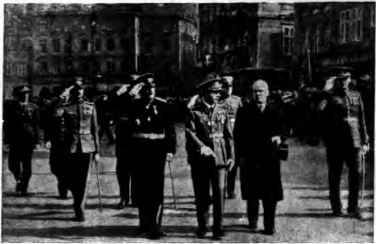
General Nešić (na lewo) złożył wizytę flocie powietrznej Czechosłowacji.