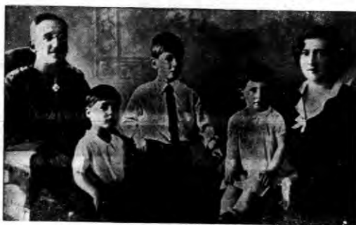
Na lewo król Aleksander z księżniczką Marią, w środku następczyni tronu, obecny król. Na prawo, królowa Maria z ks. Andrzejem.