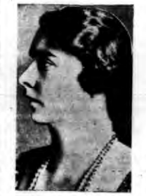
Królowa wdowa Marja