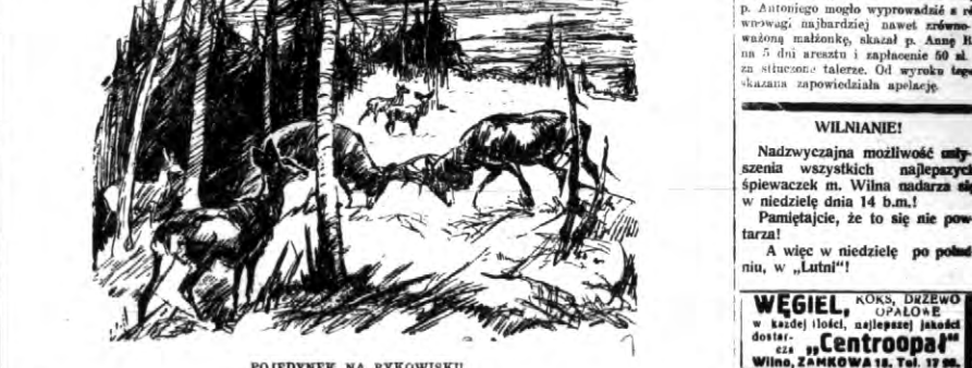
POJEDYNEK NA RYKOWISKU

„...malutkim szoku, spojrzawszy w lustro ko w kramie, podziękując, kiwnął głową... (The text continues with a narrative about a man in a forest, mentioning a woman and a child, and a conversation about a broken chalice.)