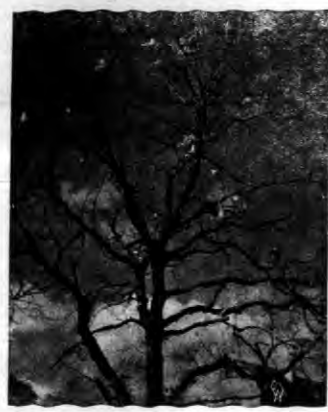
Zgęszczone drzewa przedstawiają rzadko spotykany widok: na tle jesiennego nieba po raz drugi w tym roku kwitnące kasztany. Niestety to, co jest rzadkością dla naszych oczu, jest zwykłą dla drzew, nabo prawdopodobnie jest aby drzewa jesienną po raz drugi kwitnąć nie uszły na wiosnę