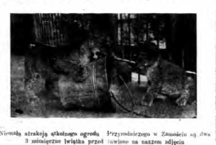
Niemalą atrakcją skłoknego ogrodu Przyrodniczego w Zamocinie są dwa tawione na naszem zdjęciu