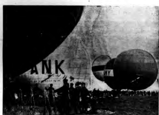
Część balonów w chwili startu.