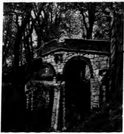
Romantyczny krajobraz jesienią.