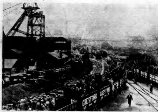
Krewi i towarzysze 271 górników w kopalni Grestord, gdzie wskutek eksplozji oraz pożaru górniczy ci straili życie.