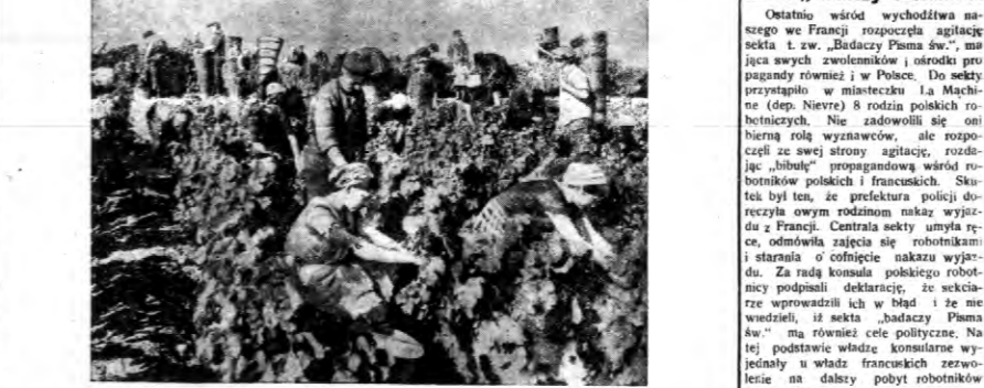
Zbiory łęgocierne wykazują rekordy w urodzaju.