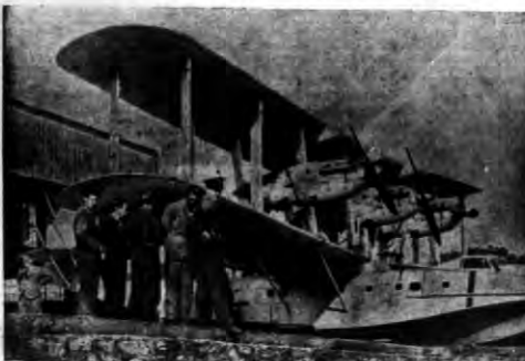
Trzymotowy wodnopłatowiec angielski w porcie Plymouth, jeden z tych dwóch, które mają wkrótce wykonać loty nad Grenlandją celem zbliżenia możliwości lotniczej komunikacji nad północnym Atlantykiem.