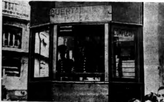
Generalny strajk w Madrycie, dzięki energii zarządu zakończył się po 24 godzinach. Połączony on za sobą odprawy w 7 autobusach i 60 rannych na 24 jeździ pojeźdźcy prowadzący tramwaj