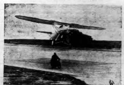
Jednym z punktów wielkich zawodów o mistrzostwo Francji w jeździe motorowej...