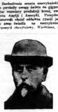
Sir Basil Zacharow

Co do zapobieżenia niecierpienia nadmiernej nierównomierności rozmieszczenia lekarzy, należałoby przyjąć szereg środków. Jednym z takich byłoby wprowadzenie w obowiązek lekarzy, aby w miastach i wsiach praktykę lekarską wykonywali w równym stopniu, jak w miastach i wsiach. W tym celu należałoby wprowadzić w obowiązek lekarzy, aby w miastach i wsiach wykonywali w równym stopniu, jak w miastach i wsiach.