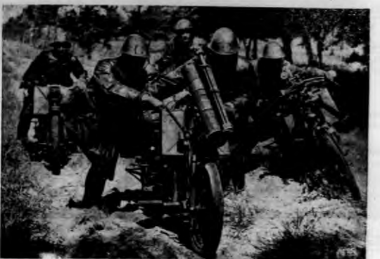
Karabiny maszynowe na motocyklach.