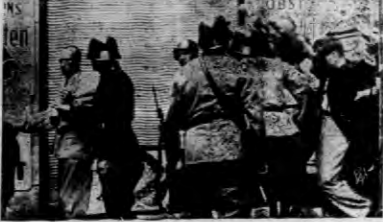
Zdjęcie przedstawia walkę o dom, w którym się mieści austriacka stacja radiowa RAVAR.