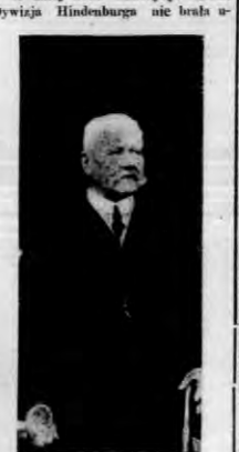
W Warszawie mieszkał przez pewnych czas porucznik Hindenburg na avenue de Paris a przedtęł, jak wspomina, starszaki. Wiczezy spe- ktał z historycznej dzisiaj restaura-

...tego trudu można było obserwa- wać rozgrywaną się dramat. — Przepowiadania żelaznego kan- clerza — pisze Hindenburg — pra- wie się opowiadza. Bismarck oświad- czył wyświełnizaj dala rewolucyj- nego; rewolucja była wrażliwa, ale nowa rewolucja was zmiezić z wi- lowy. W końcu kwietnia rozpozre- żył się w Paryżu polity. Morze ognia i czarob obkół dozymi przedzaniy- niasto, sielkierczy opowiadali prze- maciając rzeszy. Rozpozreży się ma- banki, czękojacie gład, słowem, wszystkie symptomy choroby, na którą zapadał państwo po klęsce wojennej. Dzieł nazywa się to bol- szewizm. Bolszewicy jednak nie- mają najmniejszej prawa do jakiej- kolwiek oryginalności. Pozostali tyl- ko nasłodawcom, którzy niejednok-rotnie przeciżeniży wsiły mistrzów. Z dachu swego hotelu pld Zło- tony Jelenis wydził Hindenburg lubie komuny. Wojska rzgdowote- czył Montmartre. Ostatnia sytetada komuny, poddała się po krótkiej, bez- nadziejszej walce. W początkach czerwca porucznik Paweł w Hindenburg opuścił Paryż. Nie myślał wówczas, że po latach 48- gonia, weźmie udział w sedytu do przegranej walce. Zycie 87-letniego marszałka Pawła von Hindenburga, to dzięki wstanie- ci i kwieki Niemcu. Od bitwy pod Sadową, gdzie otrzymał pierwszy chrzost bojowy poprzez episk Bi- marcku do Tannenbergu i wzrostie rozgłoszenia 1918 roku. U sęhiku swego życia musiał patrzeć marszałek na rozgrywaną się w grzyz politycy- macz ewolucja, ktorą był jed- nym z inwalidnych... Requin.