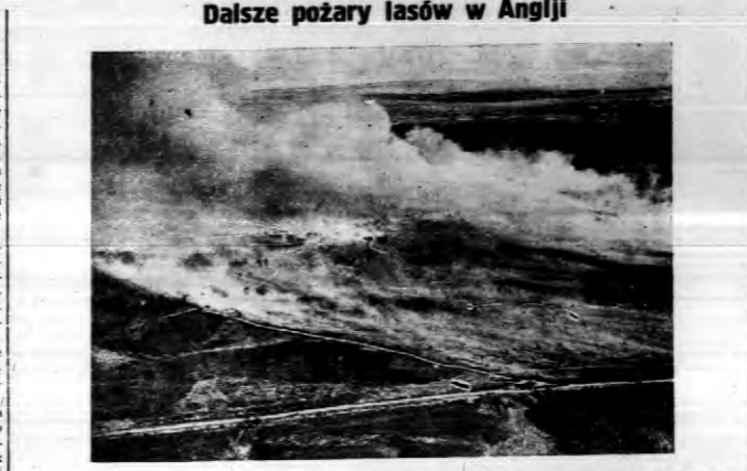
Zdjęcie powietrzne olbrzymiego pożaru lasów w Hampshire, który dopiero z użyciem trzech brygad straży ogniowej został z trudem opanowany.