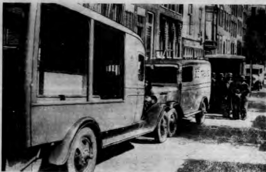
Auta policyjne, przed drukarnią komunistycznego dziennika „De Toekomst”, którego wydawnictwo zostało zawieszono.