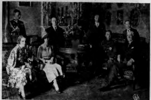
Kuzyn cesarza Japonii ks. Kaya z małżonką podczas wizyty u Pana Prezydenta Rzplitej. Na zdjęciu (od prawej w pierwszym rzędzie) Pan Prezydent, ks. Kaya, księżna Kaya, p. Marja Mościcka.