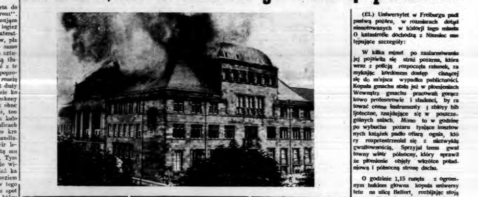
(EL) Uniwersytet w Freiburgu padł ofiarą pożaru, w rozbitej budowlonie dotychczas dotychczas w historii jego historii...