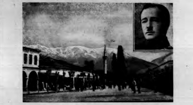
Wedle wiadomości z Albanji, wybuchło w jej głównem mieście powsta nie przeciw królowi Ahmed Zogu, — (na prawo). Zdjęcie nasze przedsta wia jedną z ulic głównego miasta Albanji, Tirany.