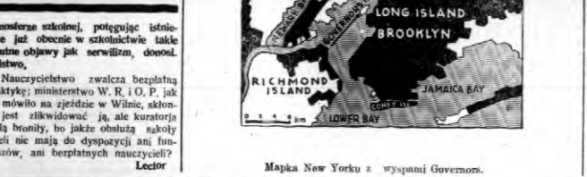
Mapka New Yorku z wyspami Governors.