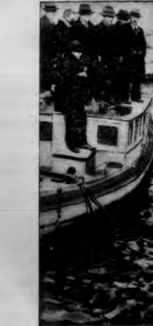
We flocie rozszalała wprowadzenie nowego rodzaju torpedy. Torpeda ta jest większa od normalnych i może ponieść dwóch ludzi, którzy kierować nią mogą aż do celu. W razie wojny kierowcy torpedy musieliby ofiarować swe życie. Jak bezgranicznie jest patriotyzm Japonczyków dowodzi fakt, że do samej próby z torpedą zgłosiło się zainiast 800 ludzi, których potrzebowało ministerwo marynarki, aż 3000. Taka liczba Japonczyków, gotowa jest zginąć tylko dla tego by państwo mogło wypróbować nową broń.