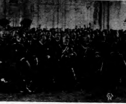
W ub. niedzielną odbył się w Warszawie w sali Rady Miejskiej zjazd Kola Żołnierzy VI baonu Pierwszej Brygady Legionów Polskich.