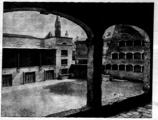
W przedpionku Domu Zabaw Ludowych w Salzburgu wybuchła bomba. Wskutek wybuchu zostało wiele osób rannych. Wyrażone szkody są znaczne. Na fotografii budynek salzburskiego Domu Zabaw Ludowych i dziedziniec otoczony arkadami.