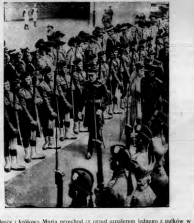
Król Jerzy i królowa Maria przechoz do przed szpalerem jednego z pułków w Olimpij pod Londynem. Oboje królowi w bierz udział w wielkim angielskim święcie sportowem wojska. Święto to wywołuje stale wielkie zainteresowanie w całym kraju i wywołuje zacnie walki między poszczególnymi rodzajami broń o pierwszeństwo.