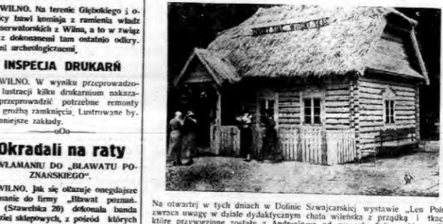
Na otwartych w tych dniach w Dolinie Szwajcarskiej wystawie „Len Polski“ zwraca uwagę w dziale dydaktycznym...