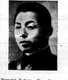
Marszałek Tschang - Hus - Liang, szef armii chińskiej.

Marszałek Tschang - Hus - Liang, szef armii chińskiej... W tym celu władze resortowe przeprowadziły szereg działań likwidacyjnych.