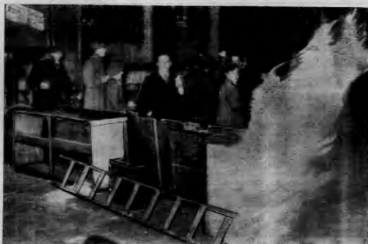
Placowa larykada na ulicach Kopenhagi, obywateli, którzy wskazują na powódnie niebezpieczeństwo zagracające stolicy Danji.