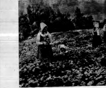
Figurki obrazek laki usiane kwieciami w Szwecji...