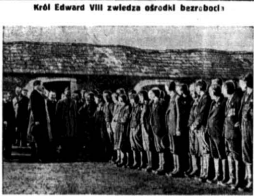
Król Edward angielski udał się w towarzystwie ministrów: pracy i zdrowia na objazd wykazanych ośrodków bezrobocia w południowej Walii. Na zdjęciu — król Edward rozmawia z bezrobotnymi.

Król Edward VIII zwleka ośrodki bezrobocia