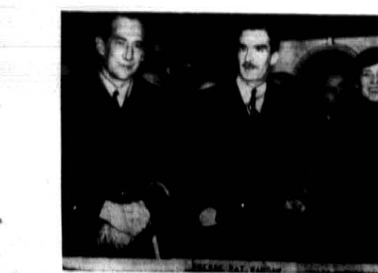
Min. Beck z matką w towarzystwie...