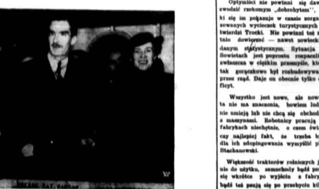
Min. Beck z matką w towarzystwie...