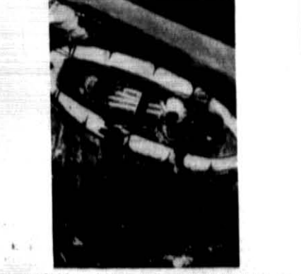
Moment, gdy jeden z marynarzy parowca „Westerland” wskazuje do potroszonej łodzi ratunkowej, w której zbliżał okrętowy przebieł 10 godzin.