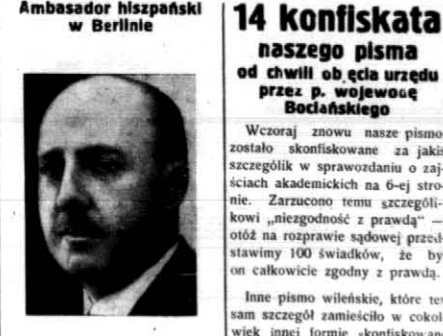
Ambasador hiszpański w Berlinie