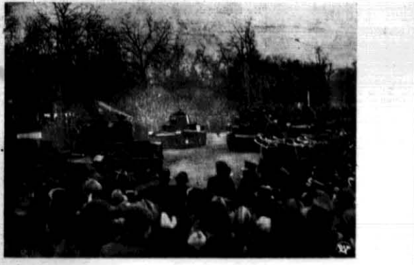
Defilada broni pancernej.