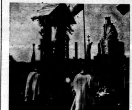
Pracownicy urzędniccy poświęcają statuu Matki Boskiej, w nowopowstałym...