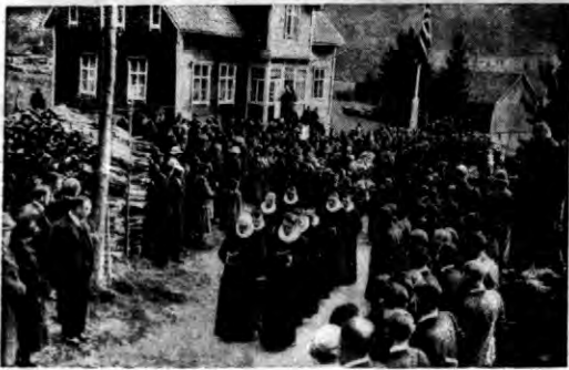
W Leen odbył się pogrzeb ofiar katastrofy osunięcia się góry w Rad.