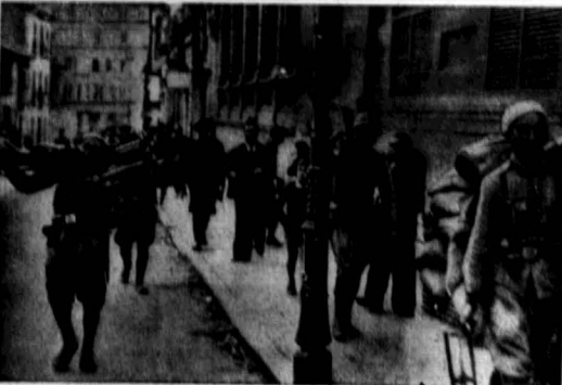
Po trzygodzinnym oblężeniu, oddziały generała Almona uwolniły miasto Oviedo.