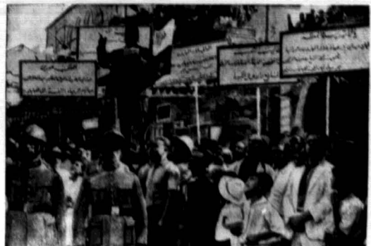
Kilkunastoletni wyrostek wzywa ludność do obrony Madrytu.