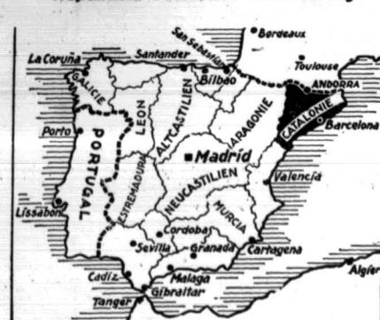
W Katalonii zaprowadzono rządy na wzór republiki sowieckiej.