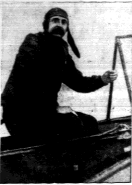
Znany lotnik francuski Louis Blériot, który w roku 1909 przeleciał pierwszy kanał La Manche.