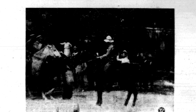
Nierепrodukowano zdjęcie przedstawiające moment wzniesienia Komendanta Piłsudskiemu medalię się dowódcą grupy harcerskiej kieleckiej.