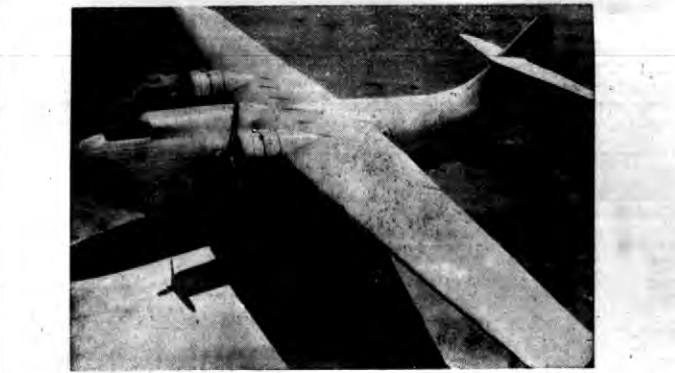
W Kalfornii wybudowano samolot komunikacyjny na 32 pasażerów. Koszt budowy wyniósł pół miliona dolarów.

„Nowy olbrzym amerykański” - Piłsudskiego